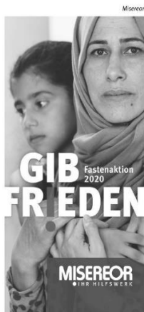
Die MISEREOR-Fastenaktion 2020 hat das Motto: „Gib Frieden“. Im Fokus steht der Krieg in Syrien und die Auswirkungen auf das Nachbarland Libanon.