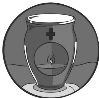
Die Kerzen auf den Gräbern legen Zeugnis von der Hoffnung ab, dass das Licht des Lebens die Dunkelheit des Todes erhellt.