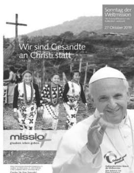
Der Weltmissionssonntag am 27. Oktober 2019 steht unter dem Leitwort: „Wir sind Gesandte an Christi statt“. Das Beispiel land ist der Nordosten Indiens.

Wer seine Spende für den Weltmissionssonntag überweisen möchte, hat folgende Konten zur Auswahl: