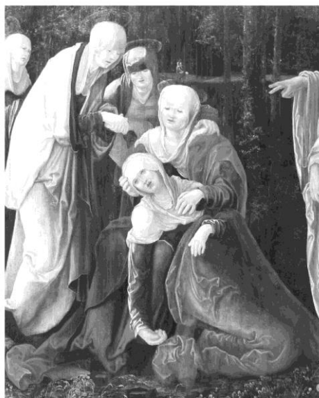
Wolf Huber (1480/5-1583), Christus verlässt seine Mutter, um 1520

Jesus verkündigt Gott als Vater, der die Menschen liebt und sie zu einer neuen Gemeinschaft verbinden will. Und allen, die Gott als Vater annehmen, fühlt er sich mehr verbunden als seiner Herkunftsfamilie. Das ist revolutionär. Die Grenzen der Familie werden geöffnet. Jeder kann zur Familie der Gotteskinder gehören.