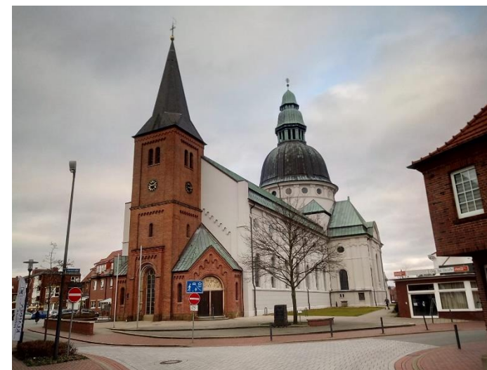
Pfarrkirche „St. Martinus“ – Emsland Dom Kirchstraße, 49733 Haren (Ems) Tel.: 05932-71270

Wir geben Ihnen gerne einige Informationen über unsere Kirchengemeinde.